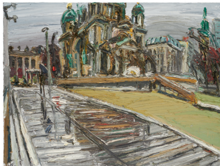
Schlossplatz-Trio (Trilogie), 2010, Öl auf Leinwand, 3-teilig je 180 x 240 cm, Sammlung Würth, Inv. 14524

Lehmpfuhl seeks the extremes. He travels the world in his mini-bus, from sea to mountains, in summer and winter. On his canvases we find both peaceful sun-drenched spring days as well as stormy scenes. He paints with all the senses. Weather conditions are an essential component of his work, influencing the material and the painter in equal measure.