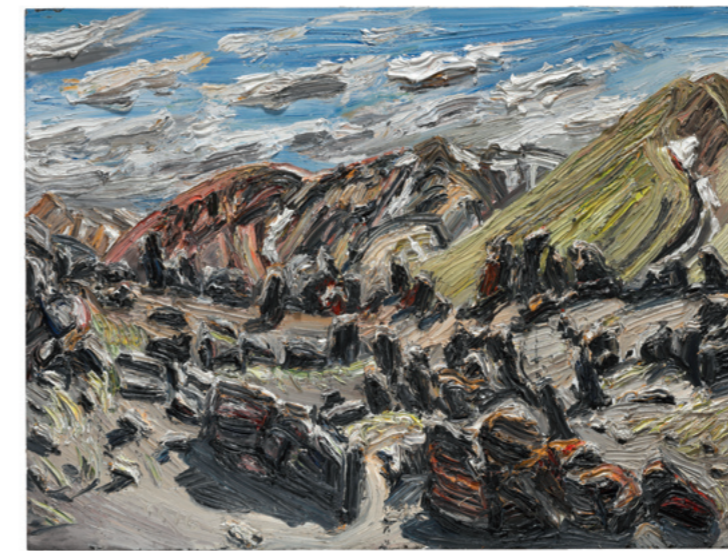
Lavafeld, Landmannalaugar, 2016, Öl auf Leinwand, 180 x 240 cm, Sammlung Würth, Inv. 17371

Lehmpfuhs Bilder zeigen einen Zustand, aber mehr noch übermitteln sie ein Gefühl, sind im besten Sinne »pathetisch«. In der klassischen Rhetorik gilt das Pathos als eine der Grundformen der Rede, die Überzeugung des Publikums durch emotionale Appelle. Wer vor Lehmpfuhs Werken steht, wird mitgenommen in die je eigene Stimmung des Bildes. Das Museum Würth widmet dem Berliner Künstler, der als Shootingstar des zeitgenössischen Realismus gilt, nun eine große Werkschau.