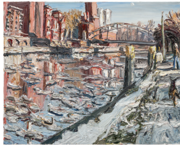
Wintertag an der Spree, 2006, Öl auf Leinwand, 80 x 100 cm, Sammlung Würth, Inv. 9393

Die Erfindung der Bleitube für Farbe war es, die den frühen impressionistischen Künstlerinnen und Künstlern es überhaupt erst ermöglichte, in großer Zahl zum Malen ins Freie zu strömen. Christopher Lehmpfuhl wiederum scheut sich nicht, Farbeimer in die Landschaft zu tragen, um dort zu arbeiten. Mit den Händen,