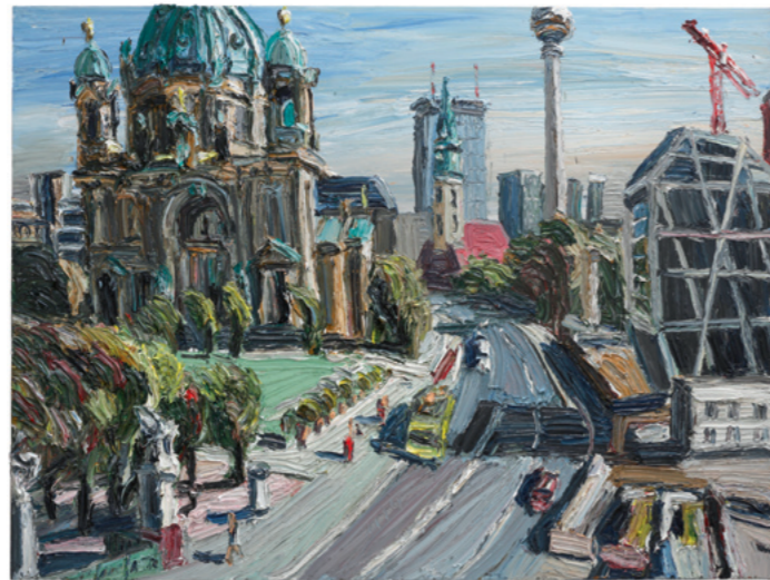
Sonniges Schloss, Februar 2016, 2016, Öl auf Leinwand, 2-teilig, je 180 x 240 cm, Sammlung Würth, Inv. 17829

ohne Hilfsmittel wie Pinsel oder Spachtel, trägt der Künstler die Ölfarbe kiloweise auf die großformatigen Leinwände auf, so ist er »direkter an der Malerei« und gelangt zu einer pastosen, dreidimensionalen Körperlichkeit.