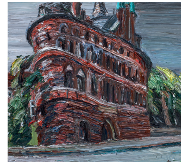
Holstentor, 2011, Öl auf Leinwand, 160 x 180 cm, Sammlung Würth, Inv. 16207

Museum Würth is now devoting a large monographic show to this Berlin artist regarded as a shooting star of contemporary realism.