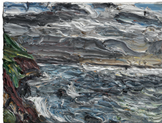
Steilküste im Abendlicht, 2016, Öl auf Leinwand, 30 x 40 cm, Sammlung Würth, Inv. 17377

Christopher Lehmpfuhl paints in the open air, which is unusual for an artist of our time. What was a revolutionary step in the 19th century, is actually still so in the particular case of Lehmpfuhl, born 1972: going out into the open, capturing a light mood, observing how colours change. It was the invention of the lead tube for paint that enabled the early impressionists to swarm out into the open air to paint in the first place. As for Christopher Lehmpfuhl, he does not shy away from carrying out whole buckets full of paint into the landscape so as to work there. Without tools such as brush or spatula, the artist applies kilos of oil paint to the large canvas using his hands, thus achieving a pastose, three-dimensional corporeality.